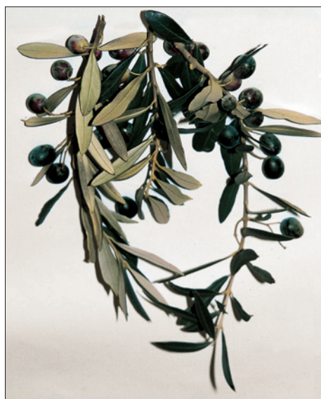
foto 11 Rami d'olivo della cultivar Rotondella con frutti