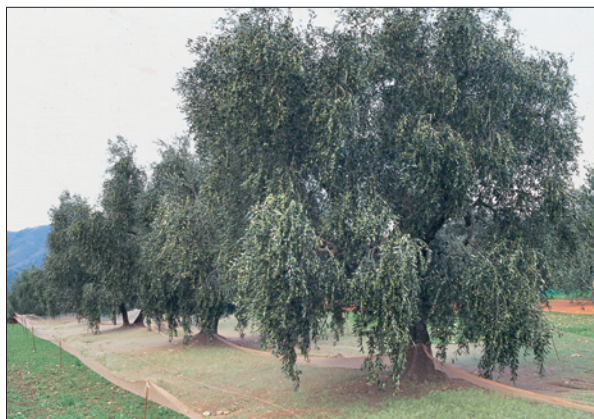
foto 8 Pianta d'olivo della cultivar carpellese

Sinonimi: Olivo piangente, Salicegna, Olivo pendente, olivo a grappolo.