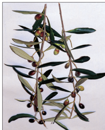
foto 9 Rami d'olivo della cultivar carpellese con frutti