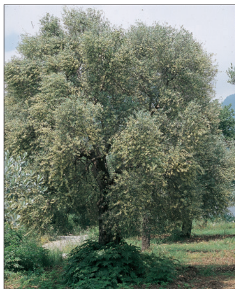
foto 10 Pianta d'olivo della cultivar Rotondella

Sinonimi: Tonnella, romanella, marinella, nostrale, olivella.